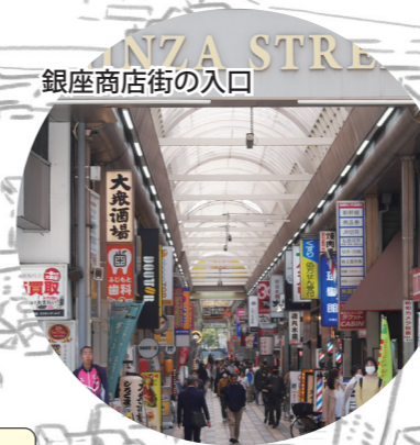
銀座商店街の入口

現役生2 きゃー、先輩、なんなんですか、いきなり学校のすぐ前に牧場が！ 牛の音が聞こえるんですけど！ 先輩 後輩たち、あわてるでない。ここは明治時代。あれは三國搾乳場のちの「三國乳業」。まだ母校が堺中学校だったころからあつた歴史ある牧場なのだ。