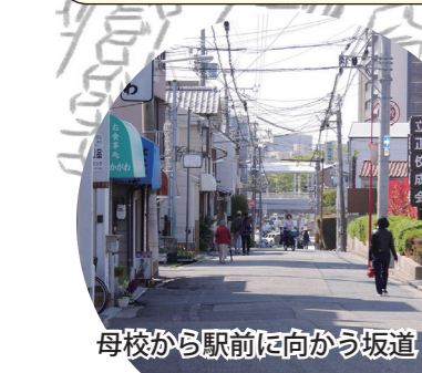
母校から駅前に向かう坂道

【現ジョルノ】 2021年4月再オープン。地上24階、地下2階。ただし上層階はマンション(プラウドタワー堺東)。B1階~3階部分がジョルノ。銀座商店街からマクド、ミスドが移転してきた。